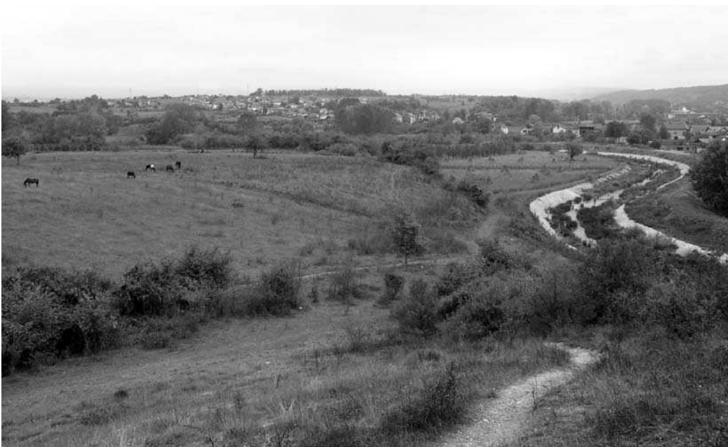
Слика 1 - Поглед на локалитет Кадијски крст Figure 1 - View on the site Kadijski krst

In the southern, longer section of the large ditch (formed during construction works) a smaller trench was opened marked as Sector II. The slope of the section was cut here only in the width of around 1 m and the length of 10 m. At the depth of 2 m, where a cultural layer of the Starčevo culture was registered, this trench was widened by around 2 m. Two cultural layers were visible in the trench section. At the depth of around 0.5-0.75 m (layer of dark brown, greasier soil) a Bronze Age layer was registered with scarce finds of crushed daub and smaller pottery shards characteristic for the Middle and Late Bronze Age. The other cultural layer, representing the Starčevo culture, was registered beneath the sterile yellowish-brown soil layer, at the depth of around 2-2.20 m from the ground surface. Besides a larger number of pottery shards common for